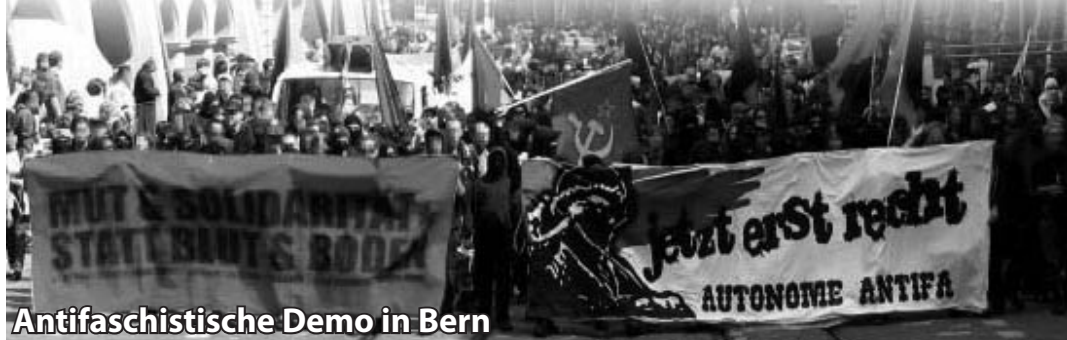
Antifaschistische Demo in Bern

von El Monfi, Revo Bern, www.revolution.ch.tc