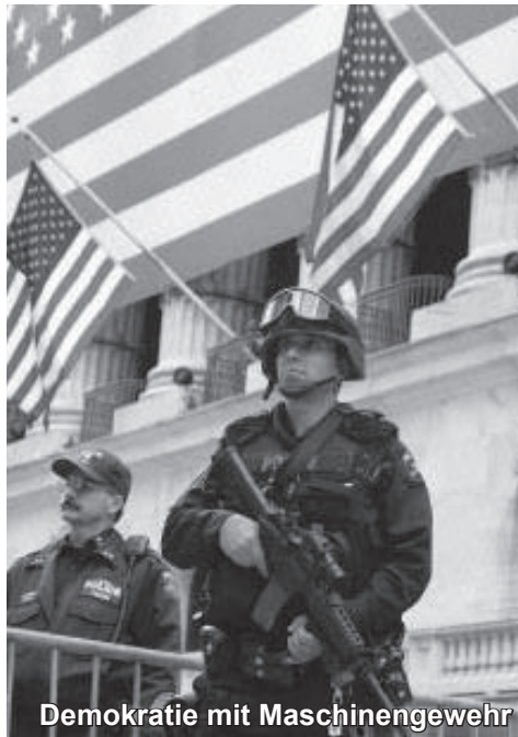
Demokratie mit Maschinengewehr

liebtheit bei der offen rassistischen Reform Party erklärt. Und er gibt zu, dass er den Kapitalismus retten will, statt ihn abzuschaffen.