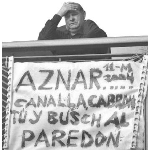
„Aznar, Canalla, Arschloch – Du und Bush gegen die Wand!“

Bei den Wahlen ist Aznar über seine eigenen Lügen und seinen eigenen menschenverachtenden Zynismus gestolpert. Er wollte die tragischen Bombenanschläge vom 11. März, als rund 200 Menschen in Madrider Pendlerzügen umgebracht wurden, der baskischen ETA in die Schuhe schieben – natürlich ohne jeden Beweis, trotz aller Hinweise, die darauf hindeuteten, dass der Anschlag nicht von baskischen Nationalisten ausging.